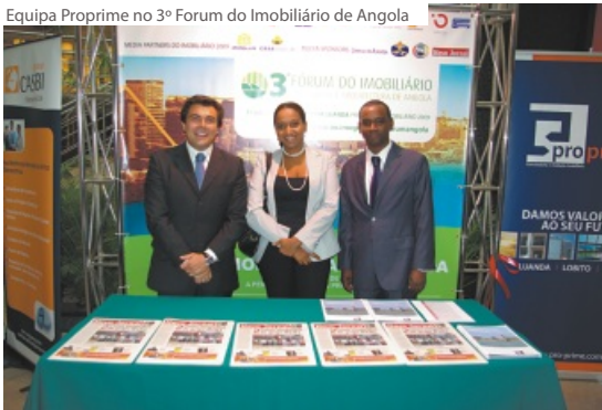
Equipa Proprime no 3º Fórum do Imobiliário de Angola