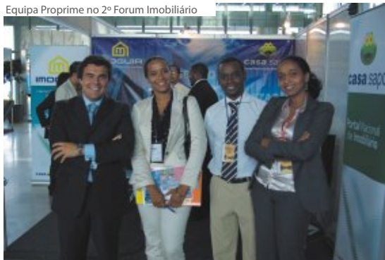
Equipa Proprime no 2º Forum Imobiliário