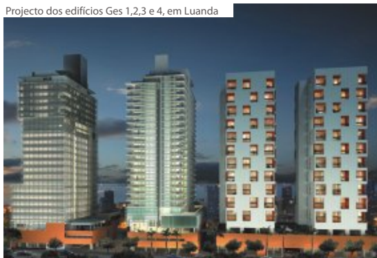
Projecto dos edifícios Ges 1,2,3 e 4, em Luanda